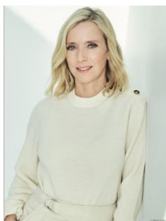
Léa Drucker

Après avoir eu le plaisir et l'honneur de recevoir (par ordre alphabétique) Josiane Balasko, Nathalie Baye, Juliette Binoche, Jane Birkin, Dominique Blanc, Carole Bouquet, Géraldine Chaplin, Aurore Clément, Béatrice Dalle, Catherine Deneuve, Maria Felix, Agnès Jaoui, Anna Karina, Bernadette Lafont, Aïssa Maïga, Jeanne Moreau, Bulle Ogier, Euzhan Palcy, Irène Papas, Micheline Presle, Charlotte Rampling, Nathalie Richard, Dominique Sanda, Maria Schneider, Hanna Schygulla, Coline Serreau, Delphine Seyrig, Agnès Varda, Margarethe Von Trotta, Monica Vitti ou encore Rebecca Zlotowski... nous nous réjouissons d'accueillir la rayonnante Léa Drucker pour qu'elle partage avec le plus grand nombre ses expériences, ses passions et ses projets lors d'un grand entretien public et une carte blanche où elle présentera des films qui ont compté dans son parcours.