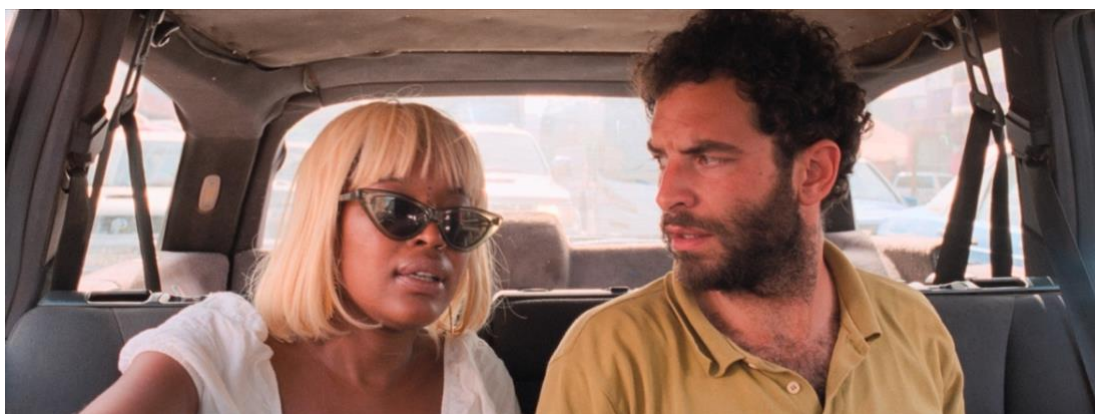
Le Rire et le couteau

📅 Samedi 14 février à 14h00, Max Linder (9 e ) / Dimanche 22 février à 17h00, l'Écran de Saint-Denis