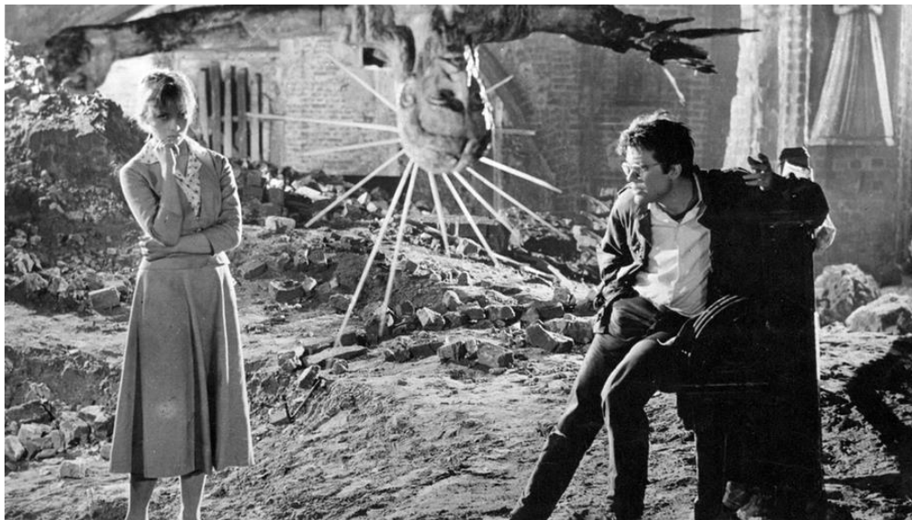
Popiół i diament (Cendres et diamant)