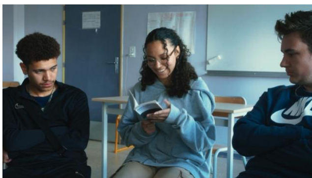
Écrire la vie - Annie Ernaux racontée par des lycéennes et des lycéens

Dimanche 22 février à 19h30, L'Écran de St-Denis