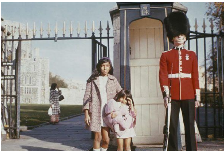
I for India

Corps et âme ( Testről és lélekről ), Ildikó Enyedi – Hongrie • 2017 • 116 min Ours d'or, Berlin 2017