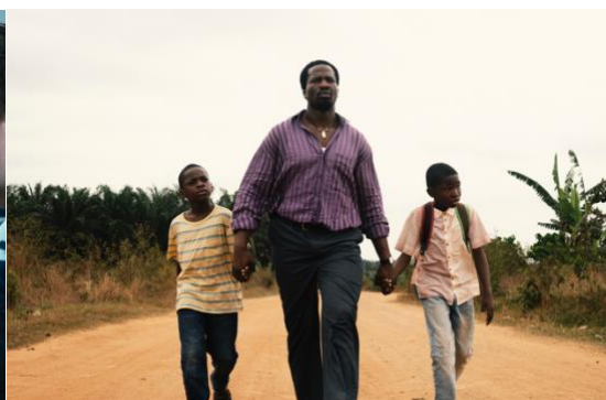
Un jour avec mon père