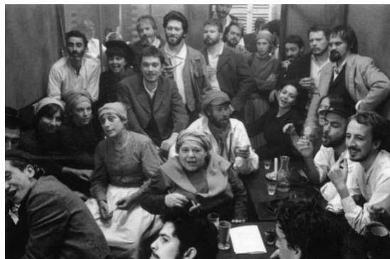
La Commune (Paris, 1871)